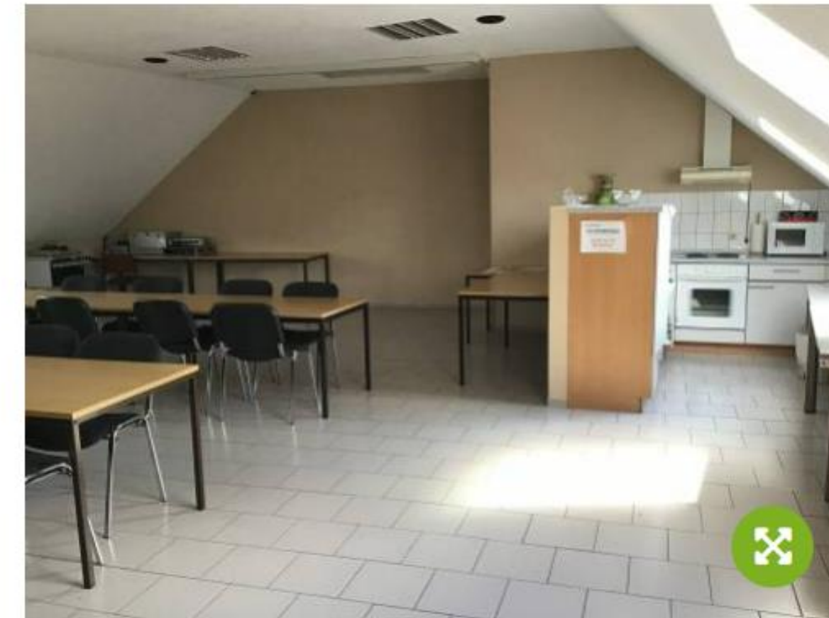
Ackendorfer Versammlungsraum (Feuerwehr): Küche und Tresen

Der Versammlungsraum der Ackendorfer Feuerwehr kann nur in Absprache mit der Feuerwehr erfolgen. Kontaktieren Sie bitte dazu die Objektverantwortliche, Frau Plate, unter der angegebenen Rufnummer.